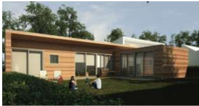
Dit is het ontwerp van de woningen, die binnenkort in park gebouwd worden.