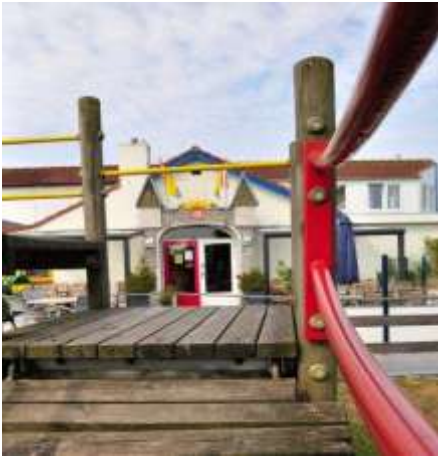
Waar nu de speeltuin is stond de vernielde boerderij