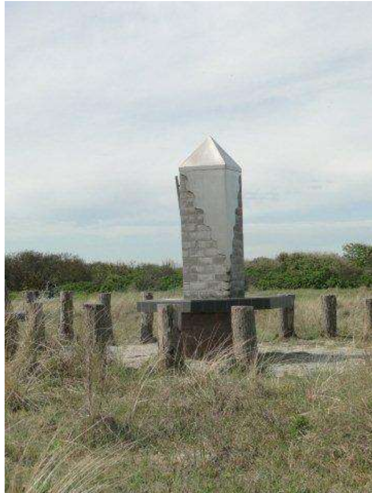
Monument als herinnering aan de Vrede van Cadzand 1492