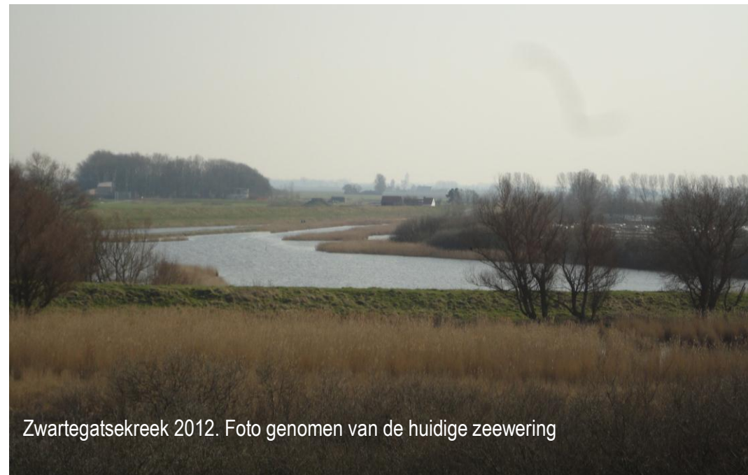
Zwartegatsekreek 2012. Foto genomen van de huidige zeewering